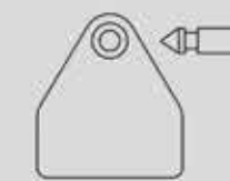
Бирки двойные Неофлекс-M 34,5 x 33 мм