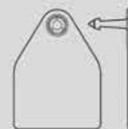
Бирки двойные Неофлекс для КРС 55 x 75 мм